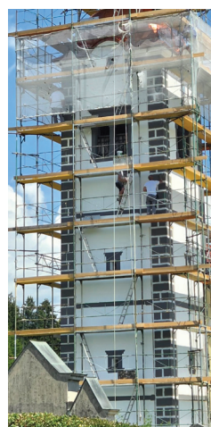
zvonik pred in po obnovi